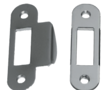
арт. Z1 арт. W2

арт. Z1 - зворотня планка для дверей з плоским торцем