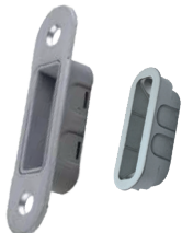
арт. W8 арт. W7

арт. W8 - магнітна пластикова зворотня планка з декоративною накладкою